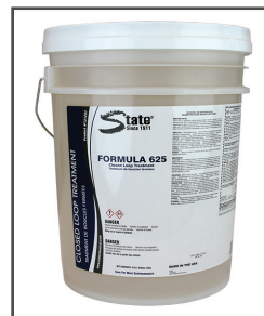
Closed Loop F-625 MC Traitement au nitrite/borate pour circuits en boucle fermée