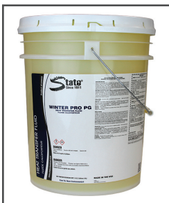
Winter Pro MC Fluide de protection contre le gel à base de glycol