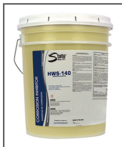
Closed Loop HWS-140 ® Inhibiteur de corrosion pour multiples composants