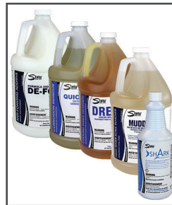
Trousse de nettoyage pour tours de refroidissement