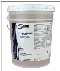
F-858 Super Cool-Ade ® Traitement pour les tours de refroidissement