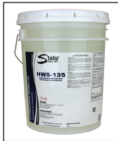
HWS-135 MC Inhibiteur de corrosion concentré