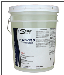
Closed Loop HWS-135 MC Inhibiteur de corrosion concentré