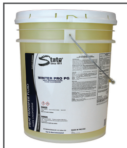
Winter Pro MC Fluide de protection contre le gel à base de glycol