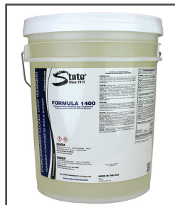
Formula 1400 MC Traitement au nitrite/borate pour circuits en boucle fermée